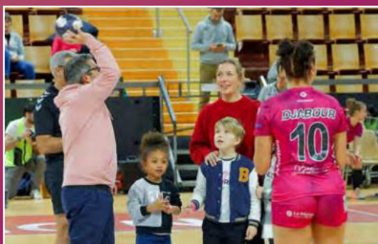
Coup d'envoi par notre partenaire Bonjour World