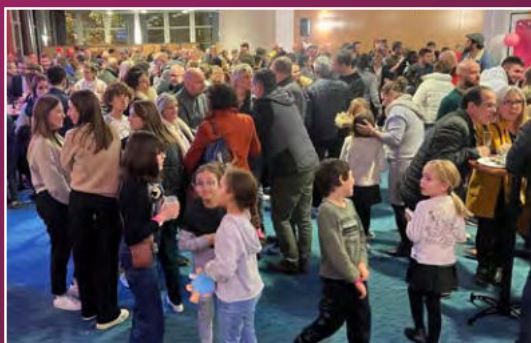
Espace VIP lors d'une soirée match