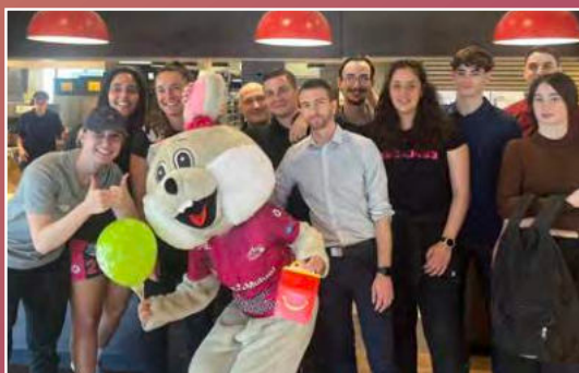
Opération de promotion chez notre partenaire McDonald's