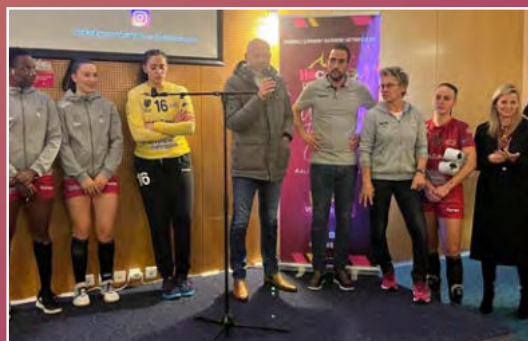
Interview d'après match Un partenaire ou une association mis à l'honneur