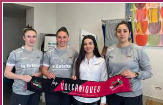
La Tournée des Volcaniques chez notre partenaire TradiEco