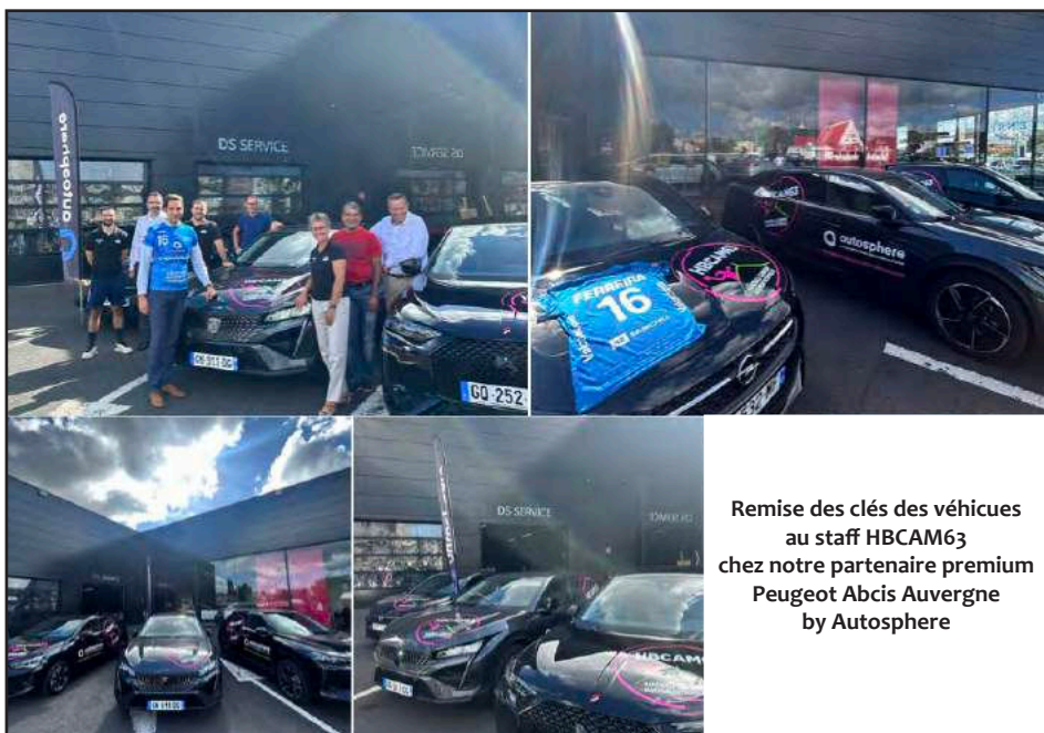
Remise des clés des véhicules au staff HBCAM63 chez notre partenaire premium Peugeot Abcis Auvergne by Autosphere

soit un coût réel pour l'entreprise de 1 200 € TTC