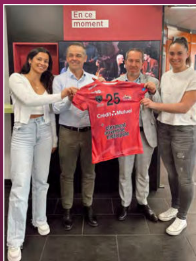
Visite à notre partenaire Le Crédit Mutuel