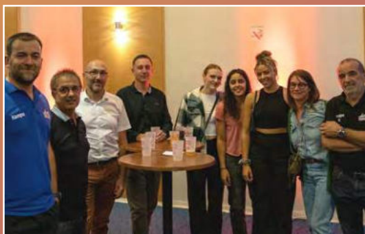
Soirée Speed Meeting à la Maison des Sports